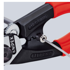
De eindkappen op de Bowden-huls persen