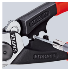
De eindhulzen op de trekkabel persen